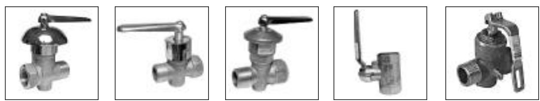
Llave de Gas con Campana MH Llave de Gas Cromada MH Llave de Gas Bronce MH Llave de Gas Esp. 4 bar Aprobada HH Llave de Gas Candado MH