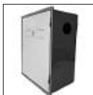
Nicho Chapa para Gas Aprob.