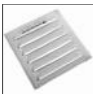
Reja Ventilación Esmaltada