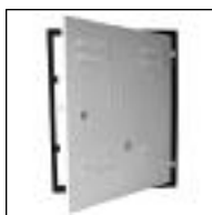
Tapa y Marco para Gas Aprob.