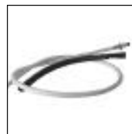
Griper para Gas