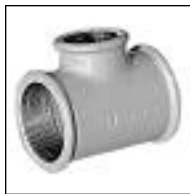
Tee 90° con Reducción