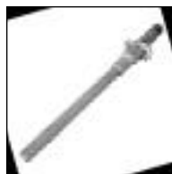
Griper para Gas