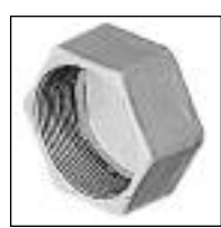
Tapa y Tapón RH