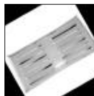
Reja Ventilación Esmaltada