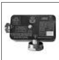
Regulador para Gas 4 Bar Aprobado