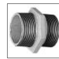
Niple con Tuerca