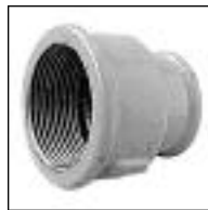
Cupla HH con Reducción