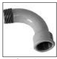
Curva 90° MH