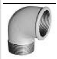
Codo 90° MH