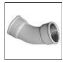
Curva 45° HH