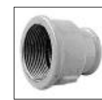
Cupla Reducción HH