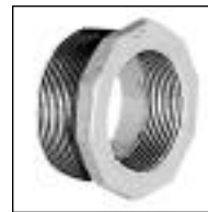
Buje MH con Reducción