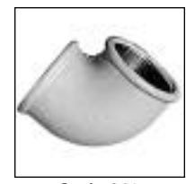
Codo 90° HH