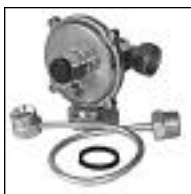
Regulador para Gas 4 Bar Aprobado