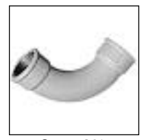
Curva 90° HH