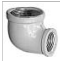
Codo 90° HH con Reducción