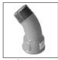
Curva 45° MH