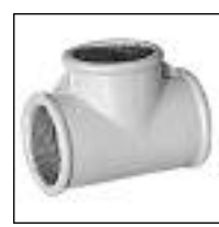
Tee HHH / 90°