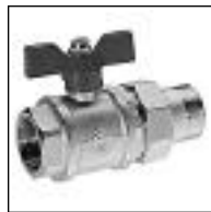
Válvula Esférica con 1/2 Unión