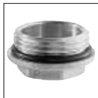
Tapón para Colector