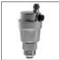
Purgador Automát. c/Válvula de Retenc.