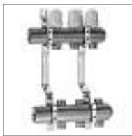
Colector Mandos Integrados