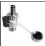
Grifo de Vaciado